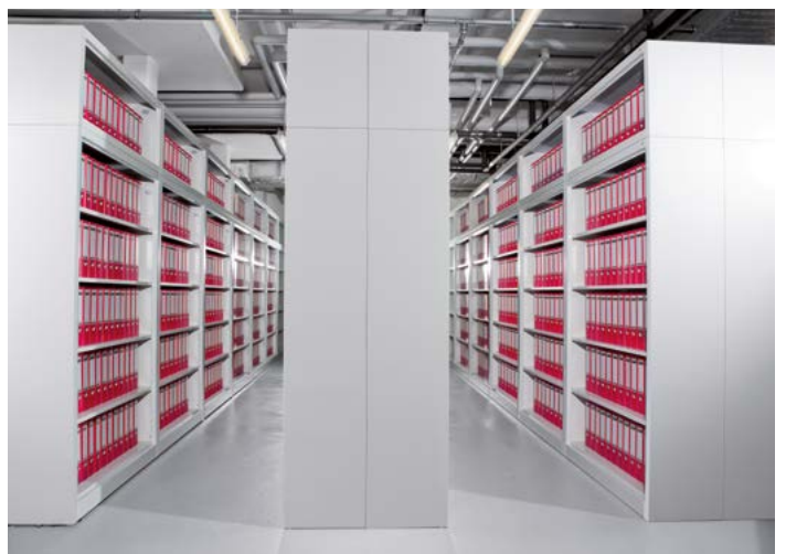
Kantoor en archief