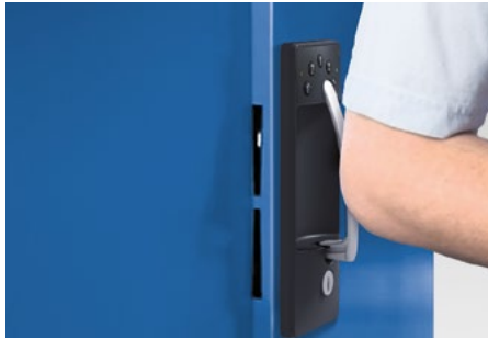
Nach Entnahme sperriger Güter: einfach zudrücken