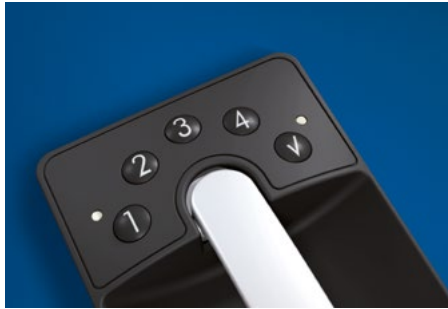
Elegantes Design, ergonomisch für optimale Bedienbarkeit